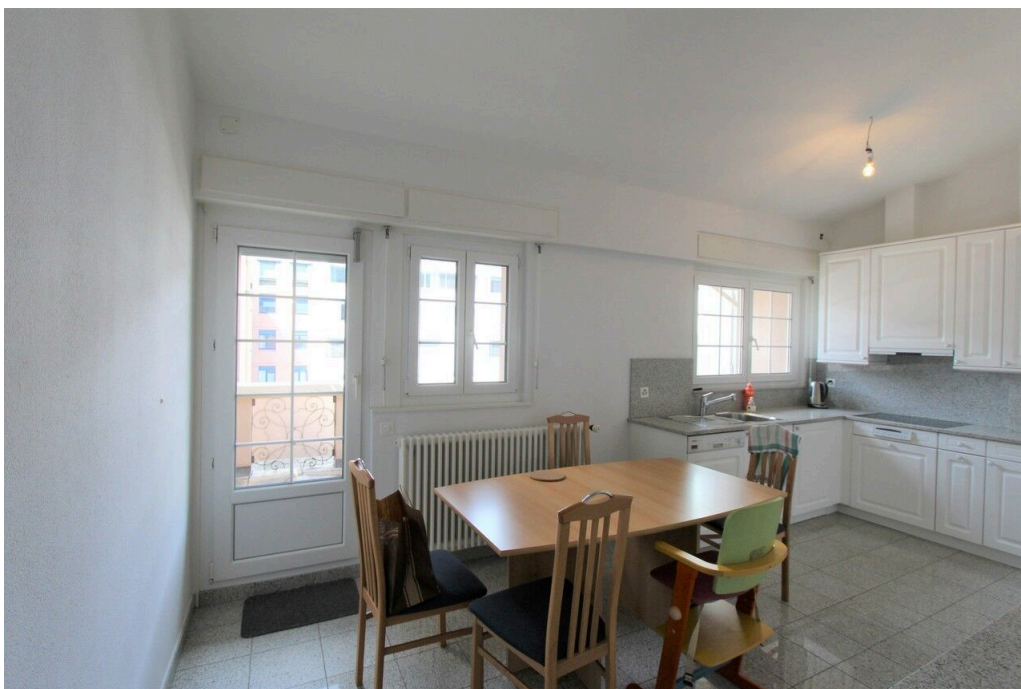
Cuisine ouverte sur la salle à manger