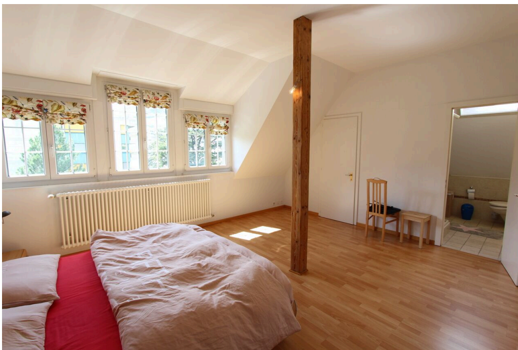
Chambre 1 avec dressing et salle de bain privative