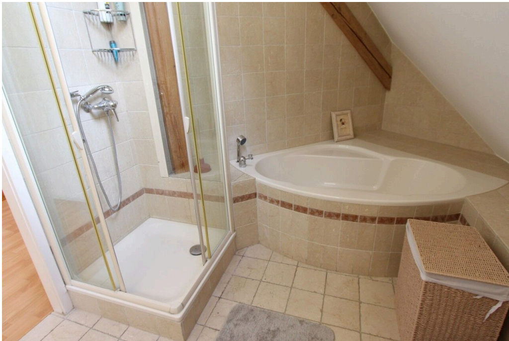
Salle de bain privative