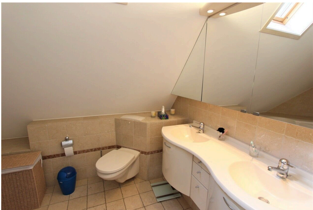
Salle de bain privative