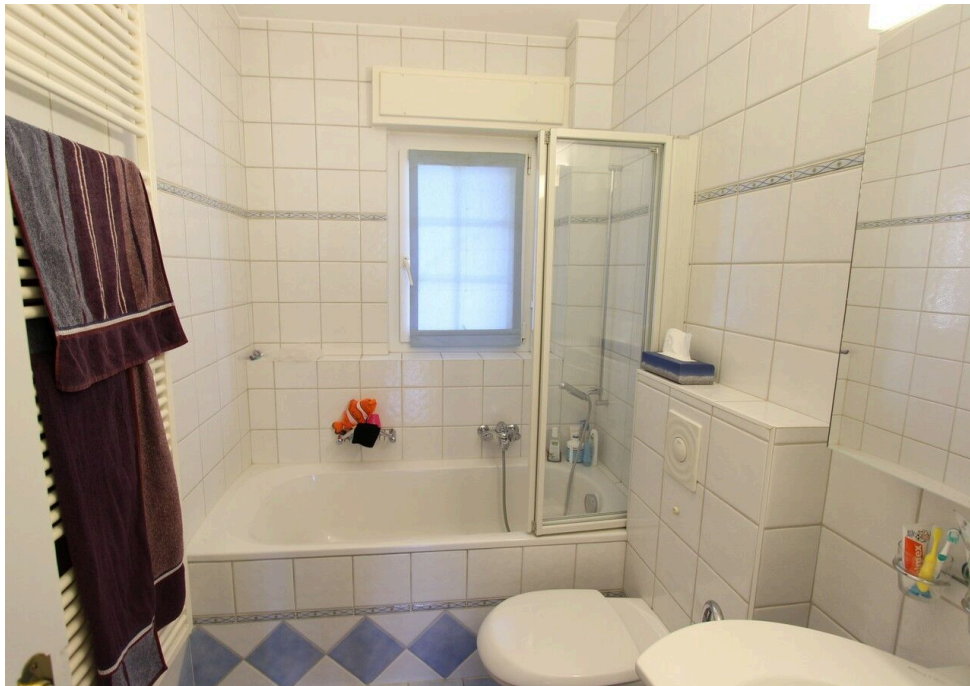
Salle de bain commune