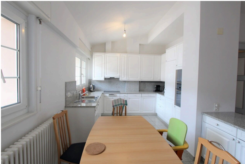
Cuisine ouverte sur la salle à manger