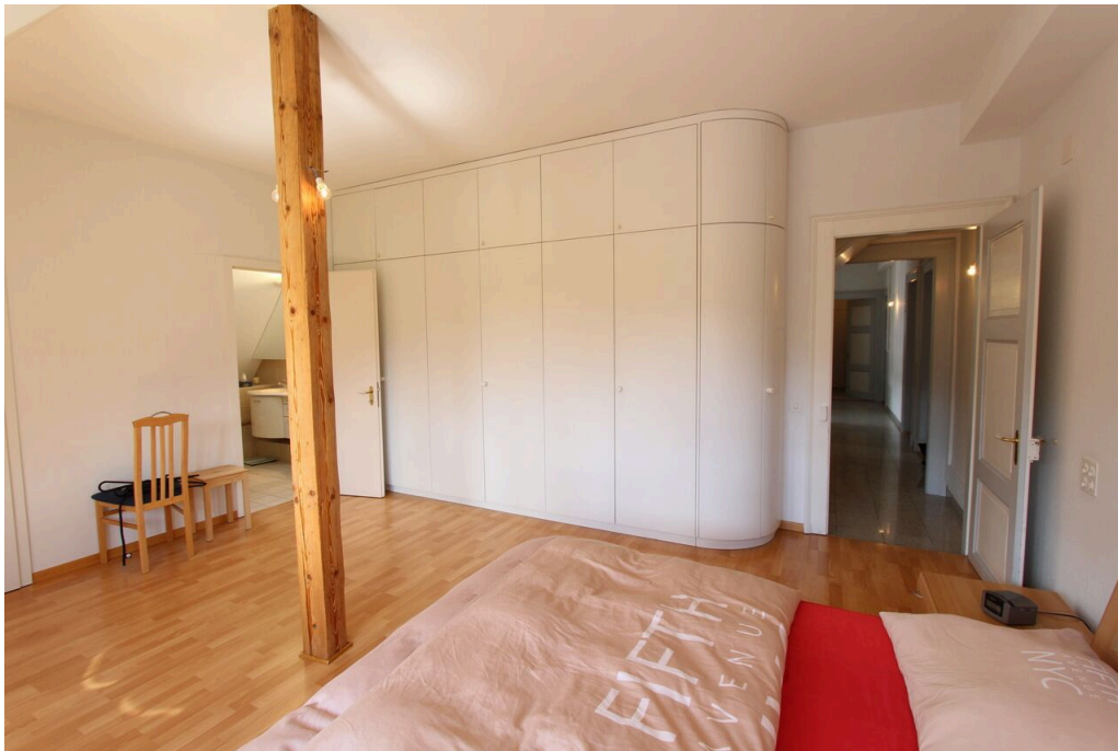
Chambre 1 avec dressing et salle de bain privative